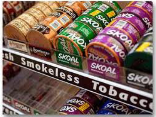
บุหรี่ไร้ควัน ผลิตภัณฑ์ยาสูบในรูปแบบของการเคี้ยว และการนัตยาเข้าทางจมูกหรือปาก

2. บุหรี่ไร้ควัน (Smokeless tobacco) คือ ผลิตภัณฑ์ยาสูบในรูปแบบของการเคี้ยว และการนัตยาเข้าทางจมูกหรือปาก มีความหลากหลายขึ้นอยู่กับระดับของ tobacco-specific nitrosamines (TSNAs เป็นยาสูบที่ใช้ในสภาพปราศจากการเผาไหม้ แต่ทำให้การดูดซึมนิโคตินเข้าสู่ร่างกายมีหลายแบบ ทั้งแบบเคี้ยว แบบอม ทั้งหมดมีส่วนประกอบสำคัญคือนิโคติน และสารก่อมะเร็งถึง 28 ชนิด) ผลทางสุขภาพที่สำคัญที่สุด ได้แก่ มะเร็งในช่องปาก และเป็นสาเหตุของการเสียชีวิต (ในเอเชียใต้ถึงปีละ 50,000 คน)