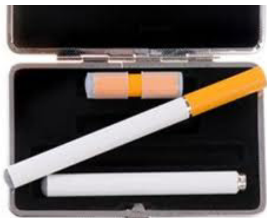
ตัวอย่างบุหรี่ไฟฟ้าที่มีการจำหน่าย อย่างแพร่หลายทางอินเทอร์เน็ต