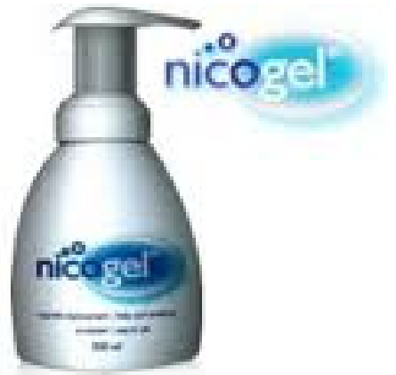
เจลนิโคติน ที่ใช้ทาผิวแล้วนิโคตินจากเจลจะถูกดูดซึมผ่านผิวหนังเข้าไปในร่างกายภายใน 30 วินาที

3. เจลนิโคติน (Nicotine gel) คือ ยาสูบบรูปแบบใหม่ที่ใช้ทาผิวแล้วนิโคตินจากเจลจะถูกดูดซึมผ่านผิวหนังเข้าไปในร่างกายภายใน 30 วินาที นี่เป็นเพียงกลยุทธ์การตลาดของบริษัทบุหรี่ที่ต้องการลวงผู้สูบบุหรี่ให้คิดว่าผลิตภัณฑ์เหล่านี้มีความปลอดภัยและไม่ต้องเลิกสูบบุหรี่ นอกจากนี้ยังเป็นการส่งเสริมให้คนรุ่นใหม่อยากลองใช้ แต่ผลิตภัณฑ์เหล่านี้ไม่ใช่ผลิตภัณฑ์ช่วยเลิกบุหรี่ ไม่ได้ผ่านการรับรองประสิทธิภาพจากองค์การ